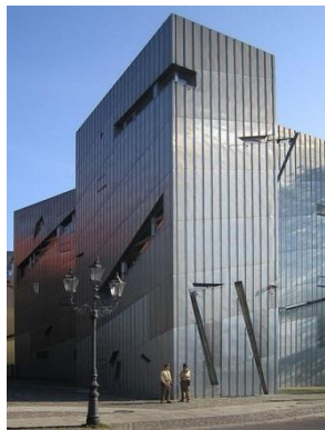
e Jüdisches Museum, Berlin; Daniel Libeskind (Amerika)