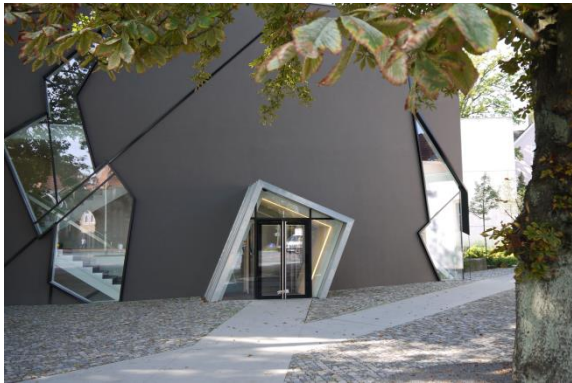
a Felix Nussbaum Museum, Osnabrück; Daniel Libeskind (Amerika)

(Nordrhein-Westfalen, nahe der niederländischen Grenze) und Berlin. Hier werden sie erst einmal der Reihe nach vorgestellt: