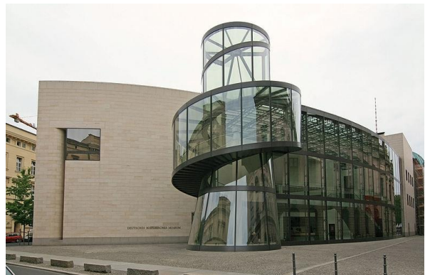
f Deutsches Historisches Museum (Neuanbau), Berlin; Ioh Ming Pei (China und Amerika)