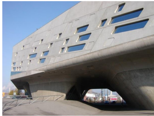
d Phaeno, Wolfsburg; Zaha Hadid (Groß-Britannien)