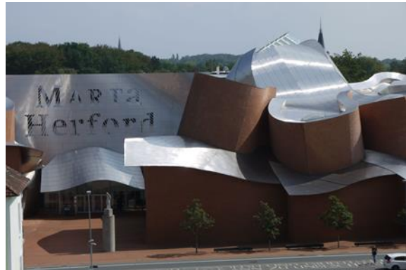
b Marta Herford, Herford; Frank Gehry (Amerika)