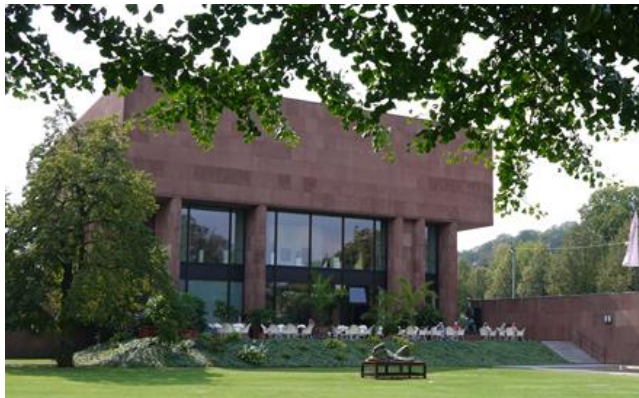
c Kunsthalle, Bielefeld; Philip Johnson (Amerika)